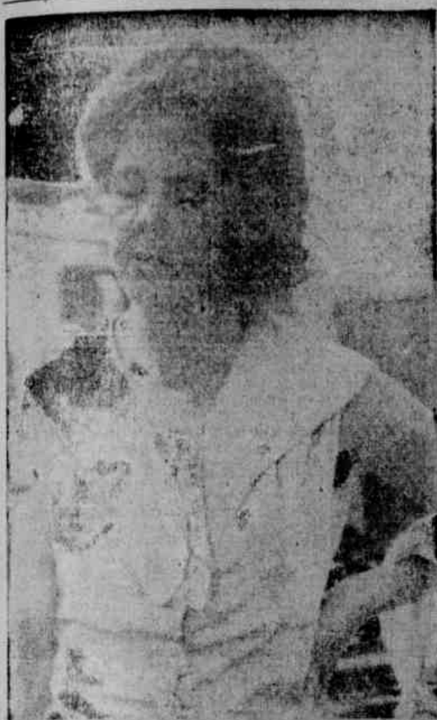
A irmã da vítima