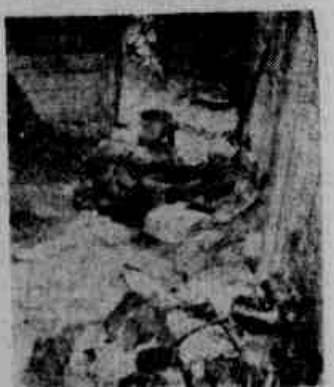
O barraco onde foi encontrada a ossada