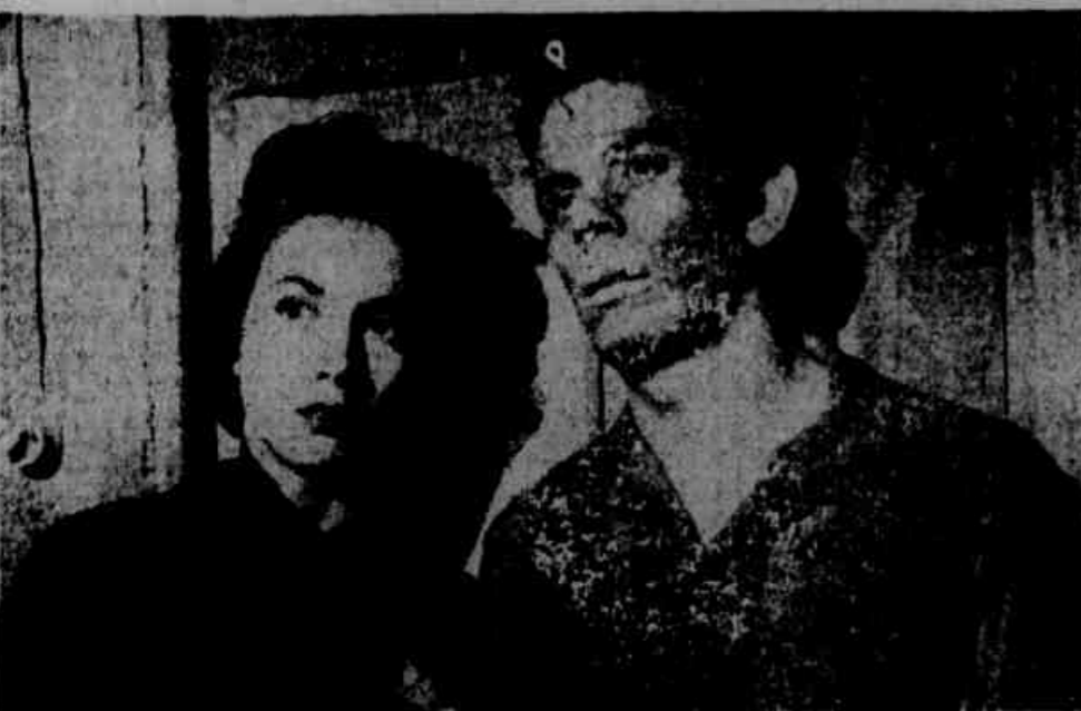
O argumentista Aline Azevedo, um dos melhores profissionais que temos em atividade no cinema nacional...