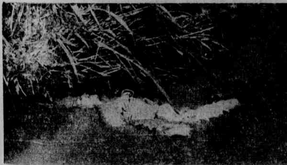
A mulher encontrada morta

Encontrado perto da linha do trem o corpo da infeliz mulher