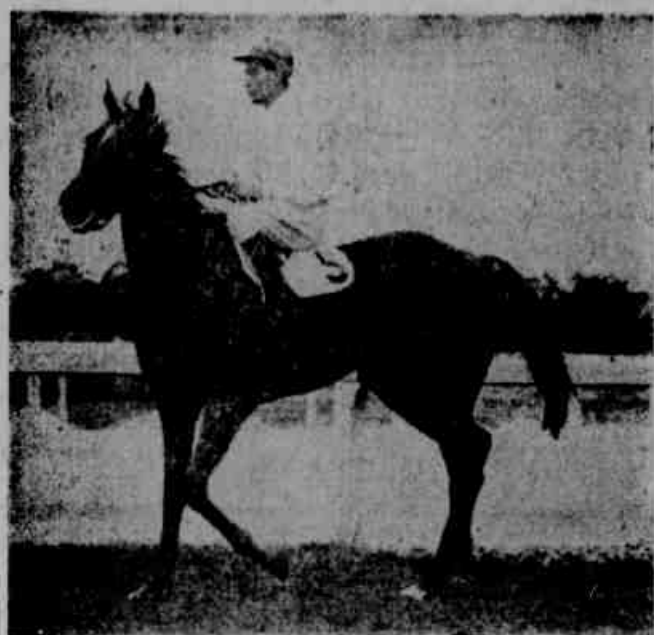
Indômita vem de São Paulo com credenciais para se tornar vencedora do Clássico "Costa Ferraz". Tão sugestiva é a sua campanha em Cidade Jardim que foi eleita franca favorita da importante competição.

A filha de Mon Cheri traz sugestiva campanha de São Paulo — Venceu, em sua última apresentação, no quilômetro e na grama pesada — Expectativa pela corrida de Excentrica na relva — Cleclara reaparece em boa forma — Apreciações sobre o clássico a ser corrido hoje no Hipódromo da Gávea