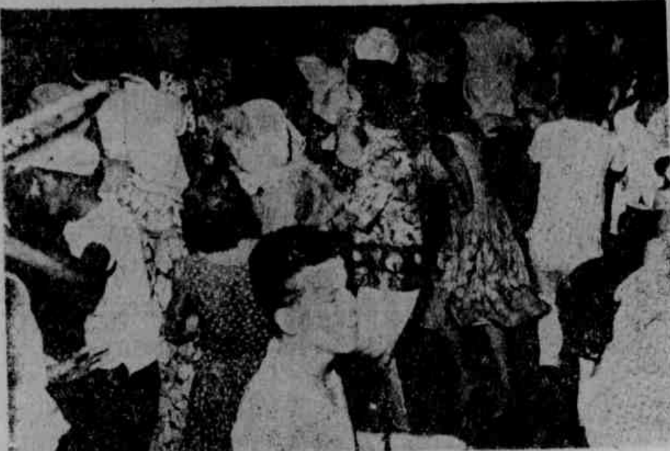
A direção do São Pedro Esporte Clube, da cidade de São Pedro da Aldeia está de parabéns, pelos magníficos bailes, oferecidos ao seu corpo social, durante os três dias de carnaval. O salão foi ricamente decorado pelas sras. Nensia Silveira Francesconi e Maria Helena Francesconi. O êxito das festividades, em muito, suplantou o dos anos anteriores. Aos bailes compareceu o maior número de socios, muitos deles, original e ricamente fantasiados. O carnaval de rua, também esteve muito animado em São Pedro da Aldeia. Muitos blocos desfilarão com notório sucesso, destacando-se entre eles, o "Bloco dos Canarinhos". Os carros alegóricos, da lavra do sr. Badu, constituíram-se em verdadeiras obras de arte.

SALVADOR, 12 (Asapress) - "Apelo para todas as pessoas de bom coração para que ajudem os atingidos pelas enchentes de Amargosa". Foi o pronunciamento do governador Juracy Magalhães tão logo teve conhecimento da catástrofe que está enlutando todo o Estado. Ao mesmo tempo o governador falando aos jornalistas fez um novo apelo no sentido de que ninguém procure se aproveitar da miséria que atingiu o bravo povo do sertão e lhe auxilie de todas as formas.