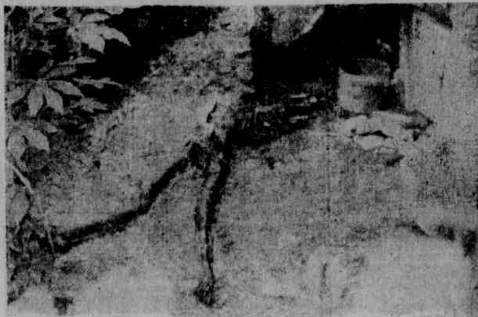
A ossada do macumbeiro

teiro, 45 anos), já com grande parte dos ossos à mostra, pois era bastante adiantado o seu estado de putrefação. Policiais (Conclui na 4.ª pag.)