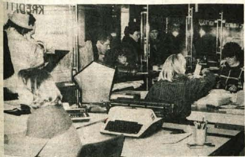
Stranke so delavcem kranjske Jugobanke prva skrb

Jugobanka torej te dni praznuje 30-letnico. Ob tej priložnosti delavci poslovalnic Jugobanke v Kranju in na Jesenicah čestitajo svojim varčevalcem in si še naprej žele dobrega sodelovanja.