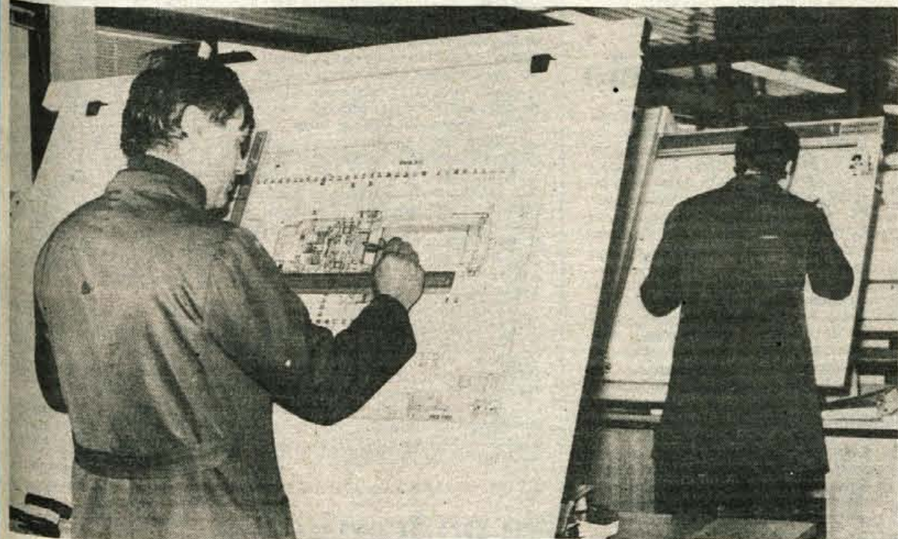
Tehnološki napredek in znanje sta eno.

GLASILO SOCIALISTIČNE ZVEZE DELOVNEGA LJUDSTVA ZA GORENJSKO