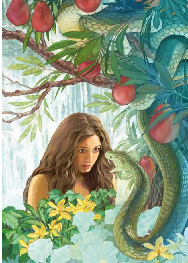
Kèt mbiyèn nganti saiki, Sétan terus ngapusi wong-wong bèn mikir èlèk soal Yéhuwah (Deloken paragraf 3-4)

5. Piyé carané mbuktèkké nèk njenengan seneng karo apa sing bener?