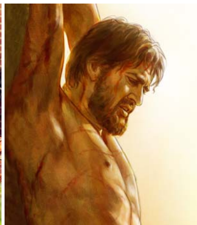
Kabèh sing apik asalé saka Yéhuwah (Deloken paragraf 12-13)

seneng atiné. (WB. 23:15, 16) Tapi piyé carané? Kuwi kétok saka omongan lan perbuatané njenengan. Nèk manut karo Yéhuwah kuwi bukti nèk bener-bener sayang karo Dhèwèké. (1 Yoh. 5:3) Hasilé, njenengan mesthi bahagia.