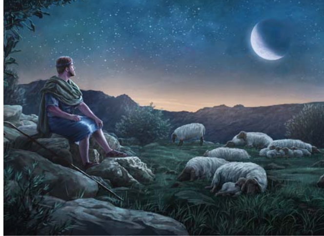
Merga ngrenungké ciptaan ing sekitaré, Daud isa ngerti sipat-sipaté Yéhuwah