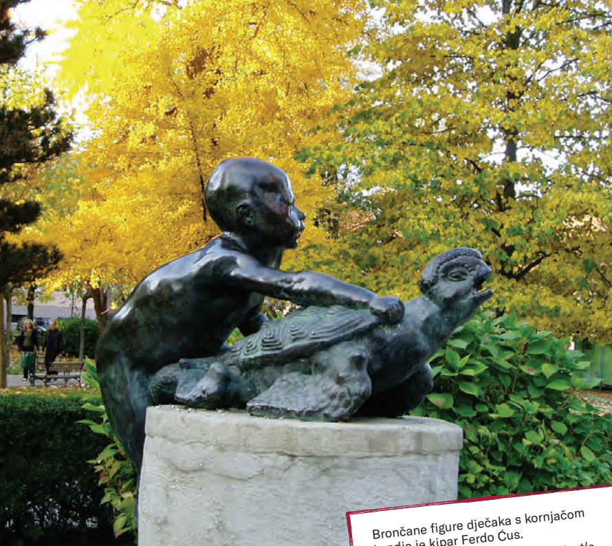
Brončane figure dječaka s kornjačom izradio je kipar Ferdo Čus. // Bronze figures of a boy with a turtle were made by sculptor Ferdo Čus.