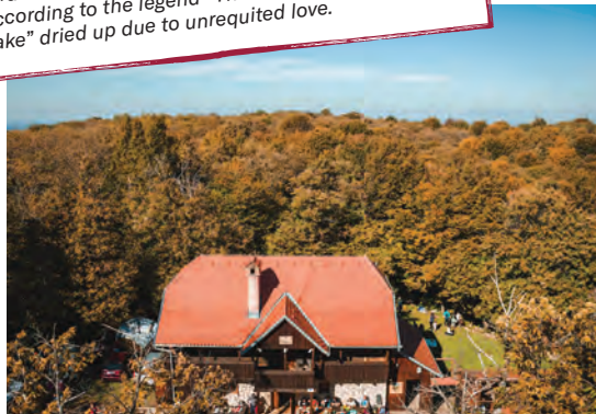
📍 Planinarski dom Matija Filjak // Mountain lodge Matija Filjak

Do sredine 20. st., Hrastovačka gora imala je fenomen: jezero gorsko oko - Pecko jezero, a koje je prema legendi "Prokletnik s Peckog jezera" presušilo zbog nesretne ljubavi. //Until the middle of the 20th century, Hrastovačka gora had a phenomenon: hill eye lake - Pecko Lake. According to the legend "The Cursed One of Pecko Lake" dried up due to unrequited love.