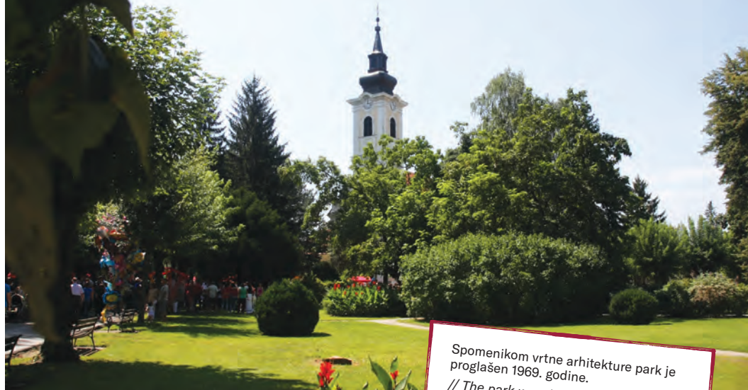
Spomenikom vrtne arhitekture park je proglašen 1969. godine. // The park was declared a monument of garden architecture in 1969.