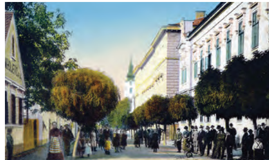
Uli. Ivana Gundulića, 1914. // Ivan Gundulić Street, 1914

// The flourishing of the century-old town