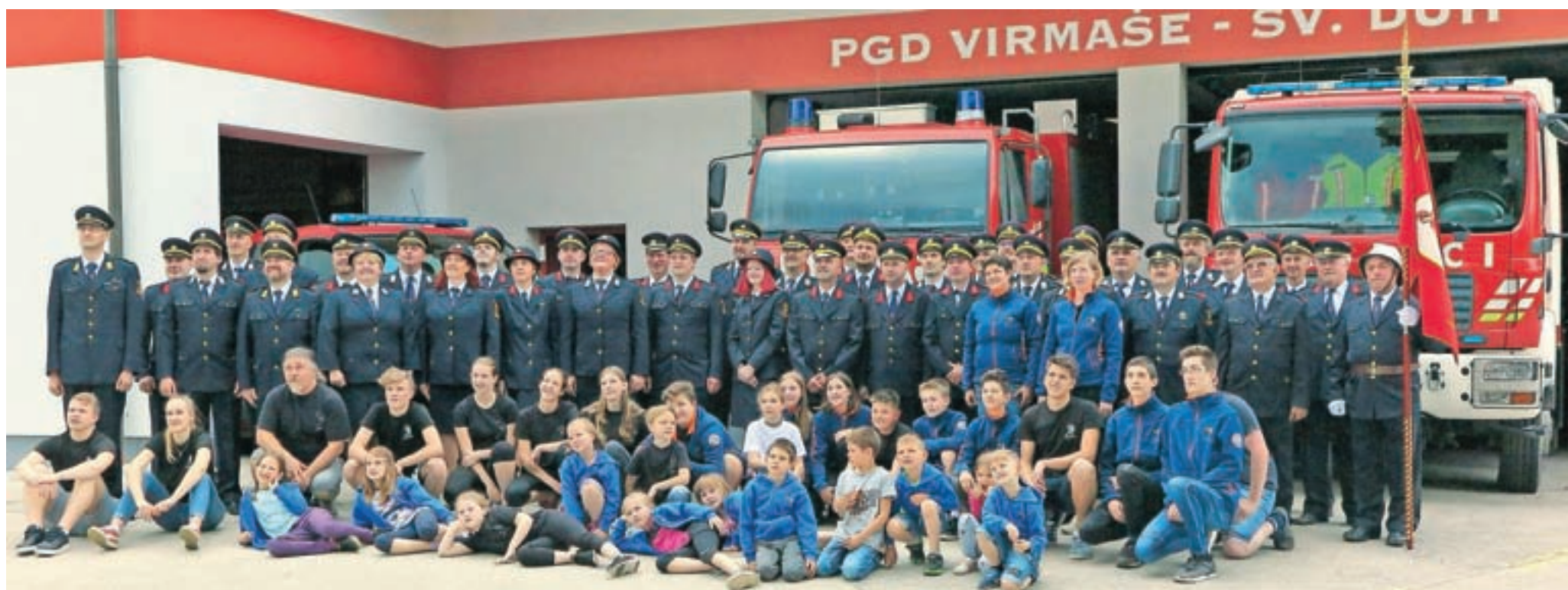
Ob stoletnici je zgleđna skrb za podmladek najboljše obet za prihodnost društva.

gasilska društva in podjetja, med njimi je bilo tudi prijateljsko Prostovoljno gasilsko društvo Muč iz okolice Splita na Hrvaškem. Najzaslužnejšim so podelili pet značk, Gasilska zveza Škofja Loka pa je podelila devet priznanj.