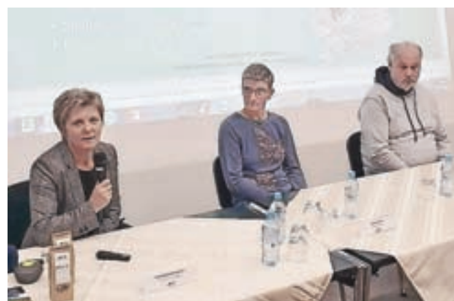
Projekt Neverjetne gore so predstavili v Slovenskem planinskem muzeju v Mojstrani.