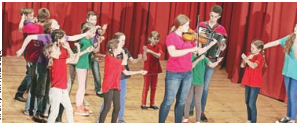
Folklorna skupina Konjički je navdušila občinstvo v dvorani Kulturnega doma Janeza Filipiča.

skupin sta dve skupini dosegle srebrno priznanje, starejša otroška pa se je odlično borila in le za las zgrešila državni nivo, s tem daje treba opozoriti na dejstvo, da so letošnji tekmovalni kriteriji še strožji kot pretekla leta. Starejša otroška skupina je v tem šolskem letu izredno napredovala na plesnem področju – v začetku maja so prikazali odlično plesno znanje, z veseljem pa so se odzvali povabilu otroške in mladinske FS iz Banjaluke in tako bodo sredi junija z združenimi močmi otroške, mladinske in odrasle skupine nastopili v BiH. Aktivni so bili tudi odrasli, ki so nastopili na Prešernovem smenju v Kranju in na paradi Tedna ljubiteljske kulture v sodelovanju s folklorno skupino DU Naklo.