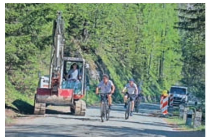
Cesta čez Vršič bo v času obnove delno zaprta, kratkotrajne popolne zapore bodo izvajali ob delavnikih.

Popolne zapore bodo izvajali samo od ponedeljka do petka, ob koncih tedna, ko je promet običajno najgostejši, pa kratkotrajne popolne zapore niso predvidene. Za dokončanje gradbenih del bodo ceste zaprli za en dan, takrat pa bo urejen obvoz čez Italijo oziroma mejni prehod Predel.