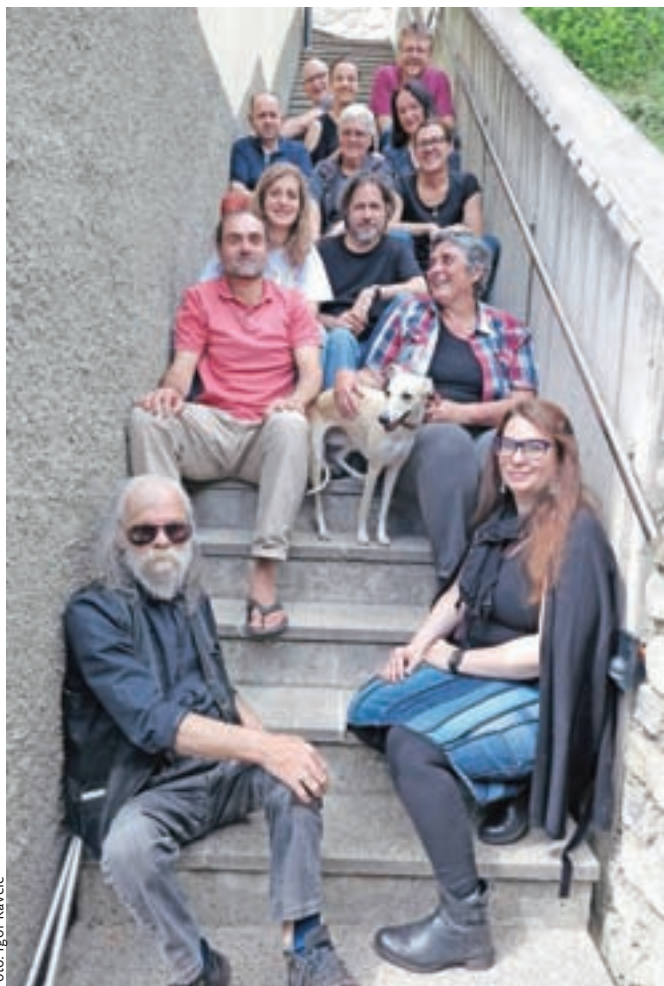
Del udeležencev letošnje kolonije na Šubičevih stopnicah