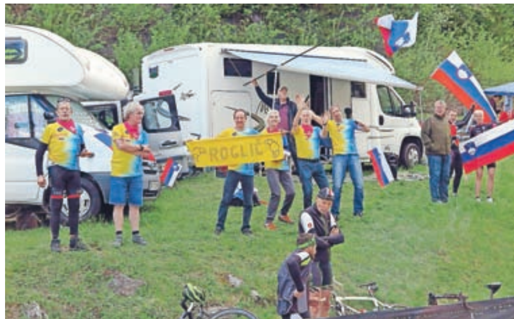
Med številnimi slovenskimi navijači so bili v petek tudi kolesarji ekipe Gorenjskega glasa, ki so dan prej zadnji, ciljni vzpon te zahtevne etape tudi prekolesarili.