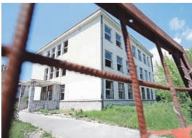
Na obnovo stare Osnovne šole Simona Jenka v centru Kranja čakajo že okoli dvajset let.

degradiranega objekta nekdanje srednje ekonomske šole za namene štirih enot vrtca, osmih enot osnovne