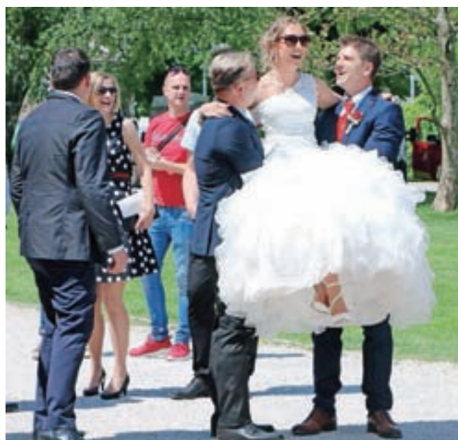
Vesela poročna družina se je odločila, da pokuka tudi na radovljiške Okuse piva. Nevesta si je izbrila poseben »prevoz« po peščeni podlagi ...

Zasledili smo še tole: 8. junija vas s festivalom piva in kulinarike pričakujejo v Vodichah, 14. junija pa v Kamniku na Kamniškem festivalu piva.