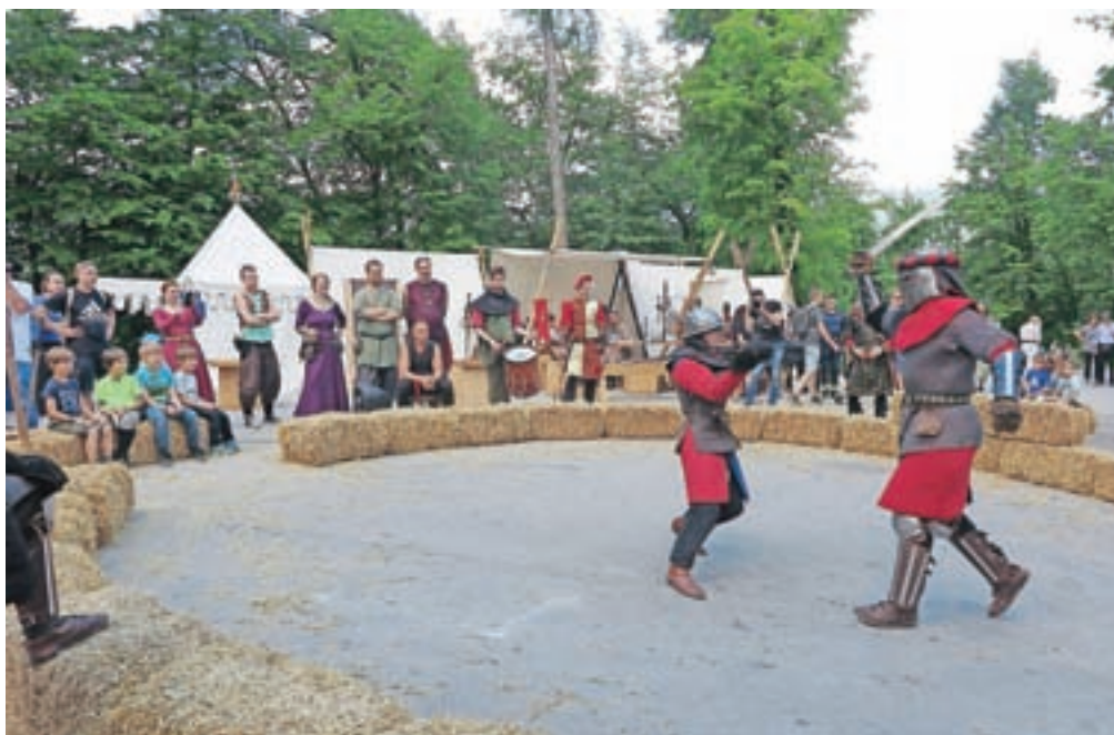
Na srednjeveški tržnici, ki so jo letos združili s srednjeveškim taborom, je bilo mogoče spremljati tudi viteške turnirje in prikaze bojevanja z meči.

Na zgornji terasi gradu so meče večkrat prekržali pogumni vitezi, med katerimi je svoje spretnosti letos prvič prikazal tudi sokolar, član madžarske srednjeveške skupine. Na spodnji grajski terasi pa so se namesto plesu z meči raje posvetili plesom ob srednjeveški glasbi, za katero je med drugim poskrbela domača glasbena skupina