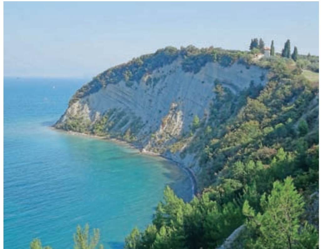
Strunjanski klif je s poti odlično viden.

Od križa nadaljujemo naprej po lepo urejeni stezi nad morjem. Približujemo se Strunjanskemu klifu. To je najvišji flišni klif ob vzhodni jadranski obali. Visok je osemdeset metrov. Fliš je mehka kamnina, za katero je značilno izmenjavanje plasti peščenjaka, laporja in karbonatnega turbidita. Morje ga konstantno izpodjeda, vremenske razmere pa povzročajo erozijo v zgornjih plasteh. Posledica delovanja narave so