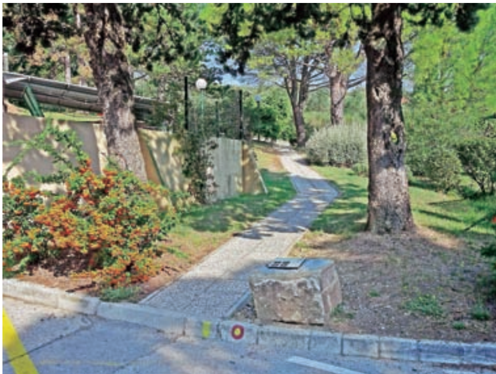
Začetek označene poti pri hotelu

Nadmorska višina: 116 m Višinska razlika: 100 m Trajanje: 2 uri Zahtevnost: ★★★★★