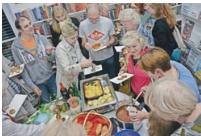
Po koncu predavanja je sledila še degustacija ukrajinskih jedi.