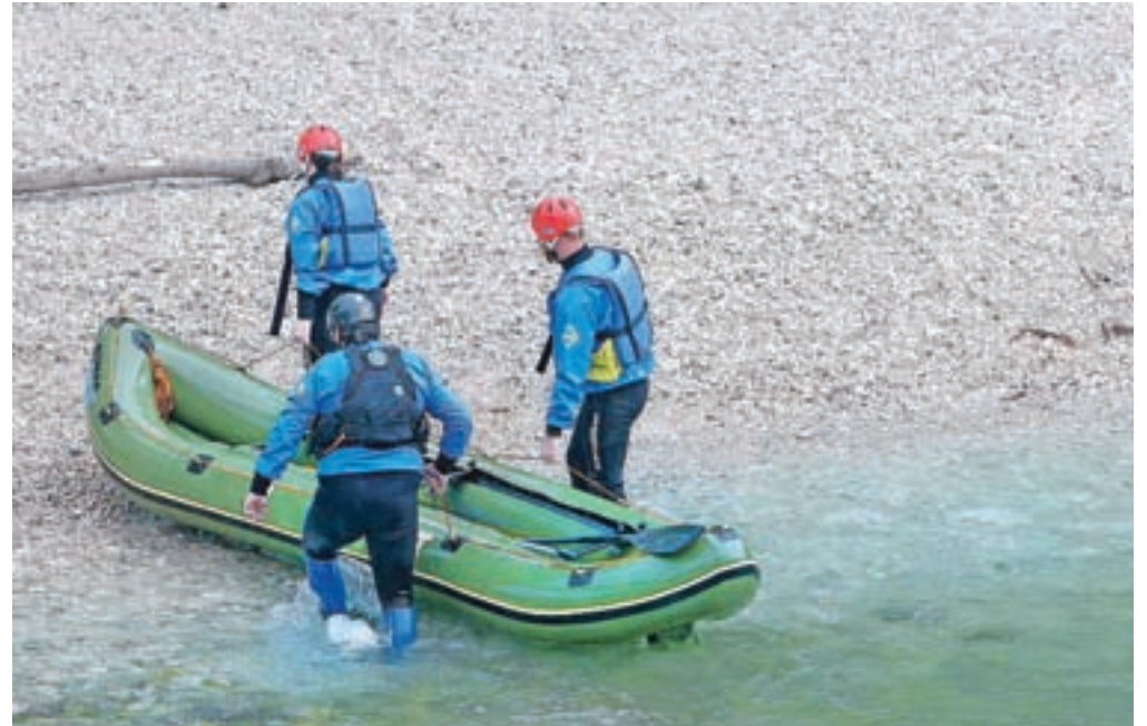
V reševanju ponesrečenih raftarjev in vodičev so sodelovali kranjski poklicni gasilci, prostovoljni gasilci z Bleda, Radovljice in Mošenj ter blejski potapljači reševalci. Fotografija je simbolična.

V nedeljo okoli poldneva se je v bližini Radovljice med spustom po reki Savi prevrnil čoln slovenskega podjetja z osmimi tujimi državljani in dvema slovenskima vodičema. »Okoliščine kažejo, da se je čoln prevrnil po trčenju v skalo na tako imenovanem »S« zavoju. Iz reke se eni turistki ni uspelo rešiti in jo je tok reke odnesel naprej,« je pojasnil Kos. Nižje na reki, pri vasi Mišača, sta 34-letno Indijko neodzivno iz vode spravila dva krajana in jo do prihoda gasilcev, policije ter reševalcev oživljala. S helikopterjem so jo odpeljali v ljubljanski klinični center, kjer je nekaj ur kasneje umrla.