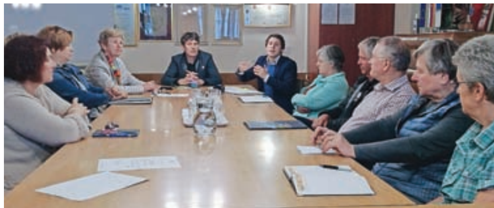
Konstitutivna seja Sosveta starejših občine Tržič