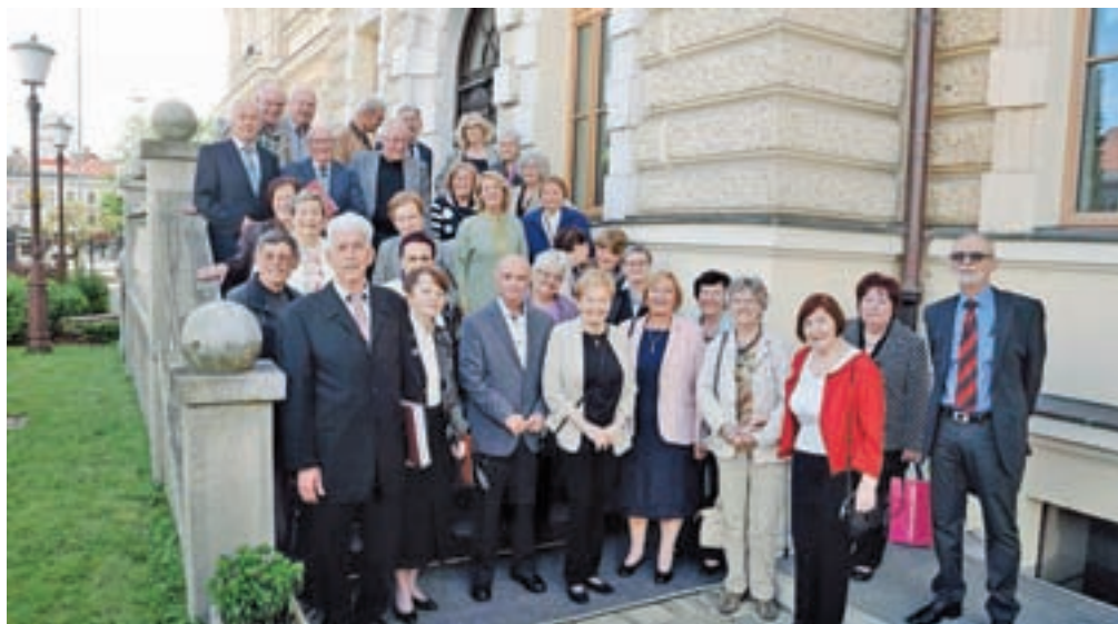
Srečanje nekdanjih maturantov Gimnazije Kranj (generacije 1955–1959) ob šestdeseti obletnici mature.