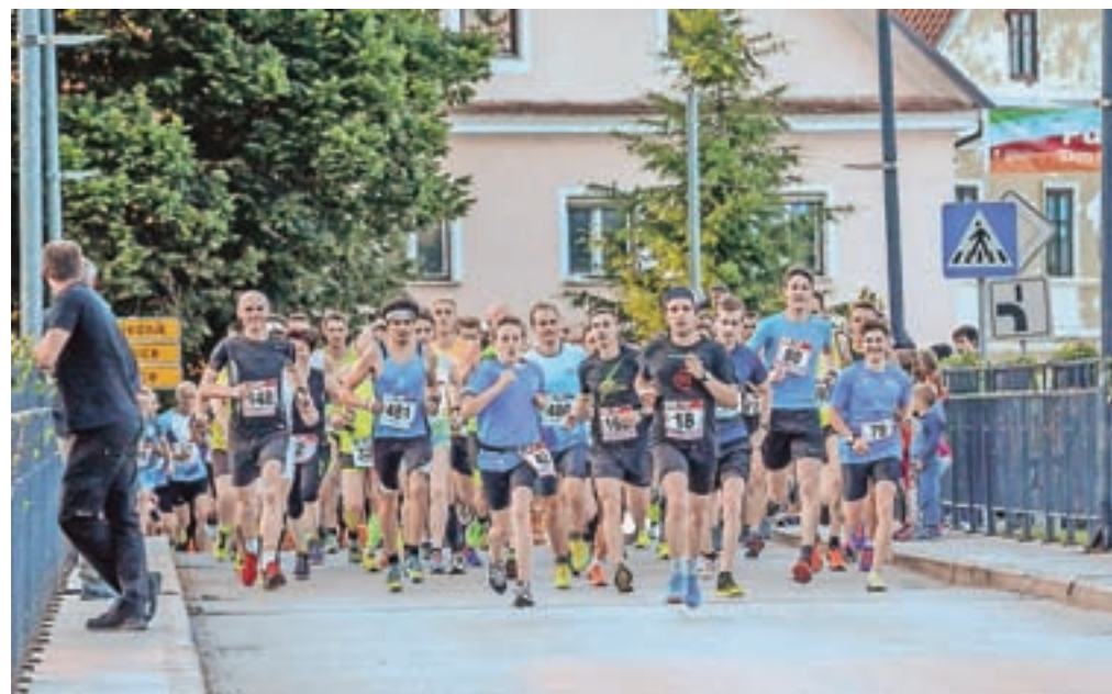
Na tretjem nočnem teku je v Medvodah teklo skoraj tristo tekačic in tekačev.

se je 735 otrok iz medvoških osnovnih šol in vrtca spopadlo s 33 gibalnimi izizvi. Glavno dogajanje je bilo v soboto, ko so bila tekmovanja v tenisu, odbojki na mivki, prstometu, na tekaških rolgah, potekal je Svet