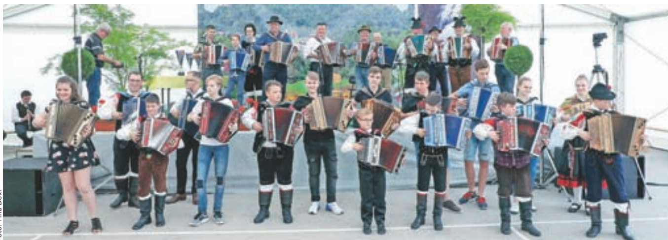
Na 28. Gorenjskem prvenstvu harmonikarjev se je predstavilo 39 tekmovalcev, ki so pred začetkom zaigrali pesem Na Golici.