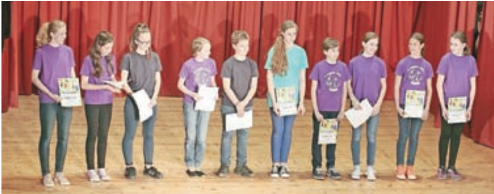
Mladi folkloristi, ki že pet in več let sodelujejo pri folklori, so prejeli posebna priznanja s strani državne institucije Javnega sklada za kulturne dejavnosti.

Folklorna skupino Podkuca, ki deluje pod okriljem KD Dobrava Naklo, je predstavila mentorica in umetniška vodja Špela Eržen. Sestavlja jo sedem starostnih skupin: FS Trden most iz Dupelj, FS Konjički, ki jo sestavljajo učenci od prvega do petega razreda, ter tri pevske in dve godčevski skupini. Vključujejo več kot sto deset članov, na tokratnem nastopu so nekatere skupine združile moči, občinstvo pa je uživalo tudi v odskih postavitvah otroških skupin, s katerimi so se predstavili tudi na območnem srečanju. Skozi razgiban program in usklajena oblačila so nastopajoči