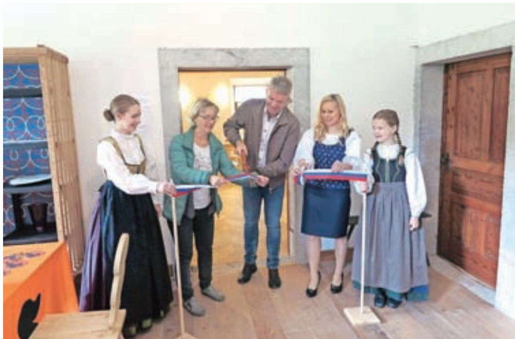
V pritličju dvorca Visoko je zaživela še kavarna.