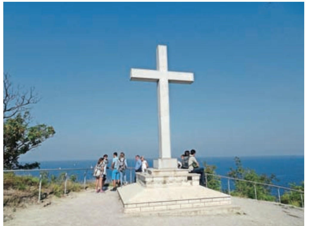
Beli križ nad Strunjanom, razgledna točka