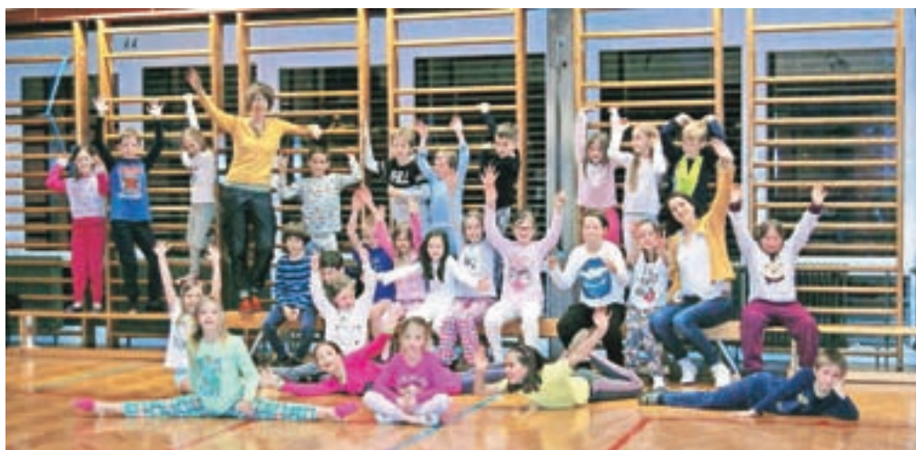
Učenci podružnične šole Kokrica so eno noč v maju preživeli v šoli.

V šolo so učenci prišli že v petek zgodaj popoldne in se peš odpravili proti kranjskemu bazenu, kjer so se v družbi animatorjev Zavoda za šport Kranj zabavali ob igranju mini vaterpola in iskanju obročev na dnu bazena, svoje spretnosti so preskusili v hoji v napihljivi